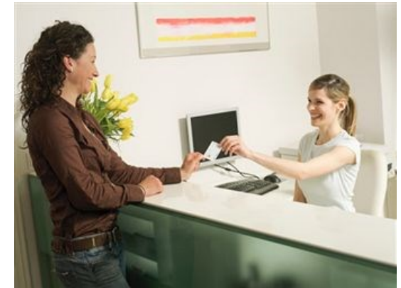
Poder Judicial del Estado de Baja California